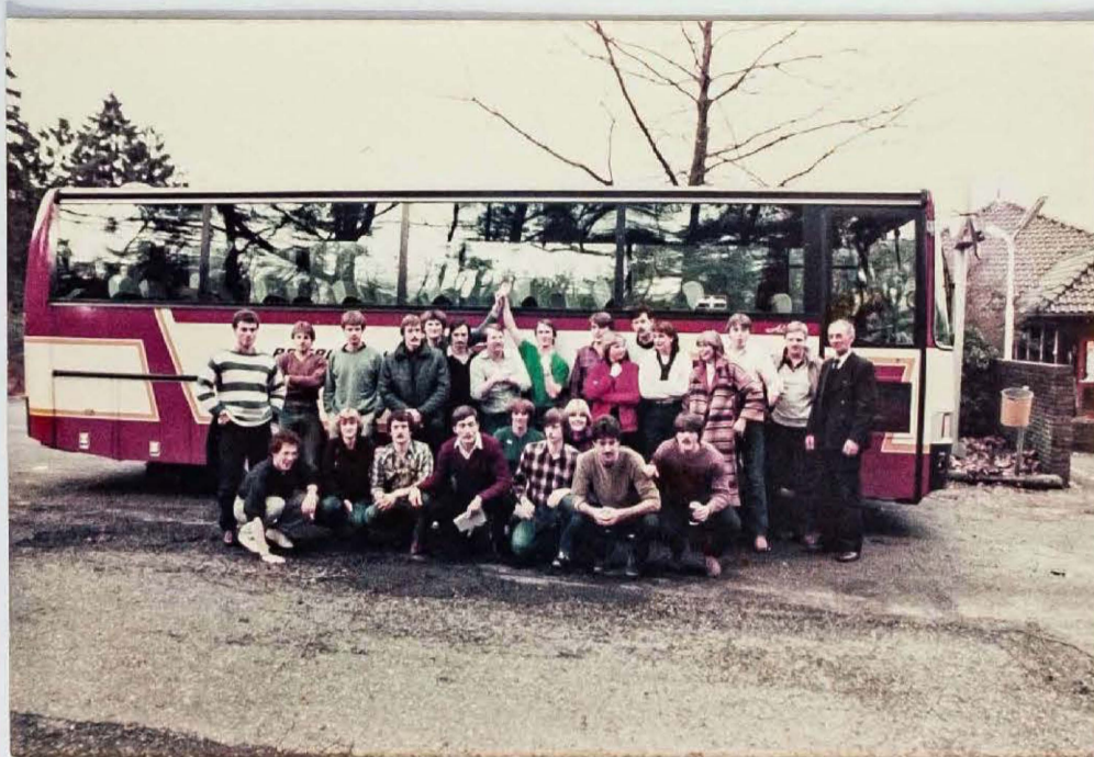
op weg met de Bus NAAR Geleen