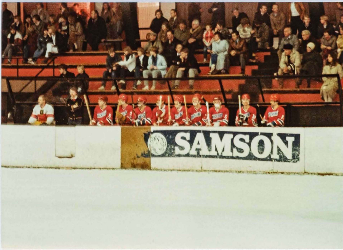
Thuis wedstrijd Gys 3de Divisie D1-D2